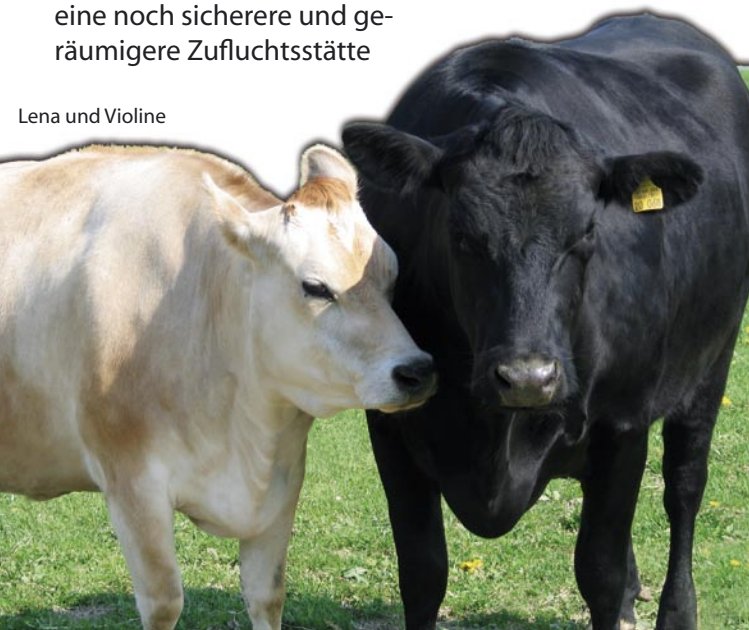
Lena und Violine